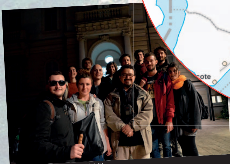
6. Il gruppo all'arrivo presso l'USI di Lugano