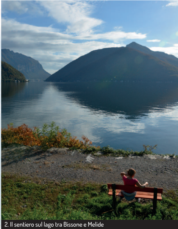
2. Il sentiero sul lago tra Bissone e Melide