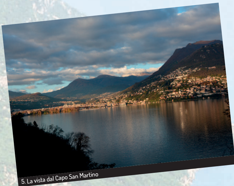
5. La vista dal Capo San Martino

La psicogeografia è una tecnica del corpo, nata con le avanguardie artistiche, che indaga lo spazio urbano percorrendolo a piedi. Oggi è diventata una pratica transdisciplinare dove convogliano vari campi del sapere focalizzati alla comprensione del territorio: la sociologia, l'economia, la geografia, l'antropologia, l'urbanistica, ma anche la letteratura, l'arte, il cinema e la filosofia. La scala del paesaggio è quella dove si gioca autenticamente la comprensione del reale, la sua complessità, le sue contraddizioni. Attraversare il territorio, rigorosamente a piedi, usando il metodo psicogeografico, significa comprendere e interpretare il paesaggio contemporaneo, fuori dai suoi luoghi comuni, restituendogli dignità e identità mediante l'indagine e la narrazione.