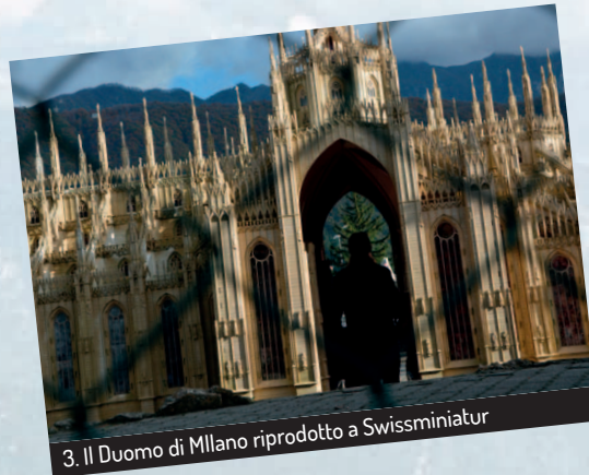
3. Il Duomo di Milano riprodotto a Swissminiatur